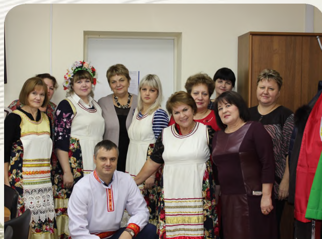
Заседание Комитета областной организации

На перспективу областной комитет Профсоюза ставит перед собой задачи по увеличению профсоюзной численности и укреплению финансового состояния, по обеспечению информационного взаимодействия профсоюзных комитетов и организации регулярного обучения профсоюзного актива.