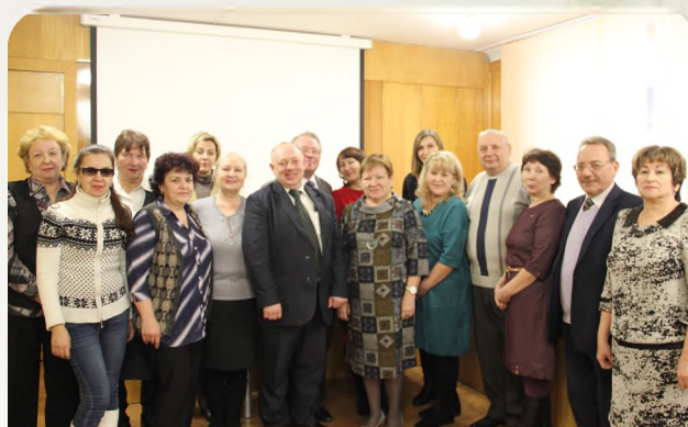
Профактив областной организации

Активная позиция областной организации позволила тесно сотрудничать с областным департаментом сельского хозяйства и продовольствия, ныне Министерством сельского хозяйства области. В тот период обком почувствовал поддержку Министерства в отстаивании экономических и социальных прав трудящихся агропромышленного комплекса. Заключаемое социальными партнерами Отраслевое соглашение стало весомым и действенным инструментом, а взаимодействие стало носить постоянный и конструктивный характер. Отраслевое соглашение