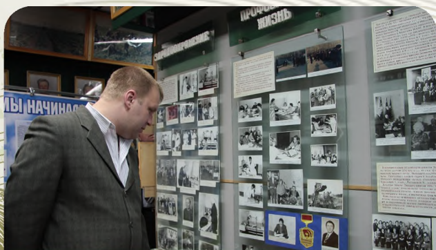
Молодежь знакомится с историей профдвижения

Основным методом профсоюзного воздействия на развитие экономики в эти и последующие годы была организация социалистического соревнования, большое внимание уделялось пропаганде экономических знаний, усовершенствованию организации и оплаты труда. Особое место занимали вопросы создания здоровых и безопасных условий труда, производственного быта, улучшения жилищных условий, организации общественного питания и бытового обслуживания, культурного обслуживания сельского населения. В области действовали 246 профсоюзных культурно-просветительских учреждений, на селе работали 452 проф-