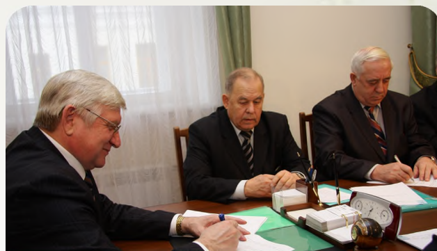
Подписание Отраслевого соглашения по АПК области, 2008 г.

На разных этапах развития государства, исходя из конкретных условий и хозяйственно-политических задач, менялась организационная структура профсоюза, совершен-