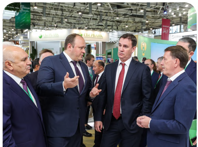
Выставка «Золотая осень»

Как отметил Министр сельского хозяйства России Д.Н.Патрушев, Российской Федерации предстоит выстроить полноценную «инфраструктуру доверия» к органической продукции и «зеленому бренду» как на внутреннем, так и на международном рынке,