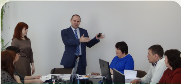
Заседание Комитета областной профорганизации в ЗАО «Сормовская кондитерская фабрика»

Профессиональные союзы стали образовываться повсеместно в период первой русской революции 1905-1907 годов. Один за другим возникали профсоюзы железнодорожников, металлистов, текстильщиков, столяров, печатников, булочников. Их цель — организация борьбы трудящихся за улучшение условий труда и экономического положения. К началу революции в Нижнем Новгороде уже насчитывалось 18 профсоюзов. В первые годы советской власти они сыграли важную роль в ликвидации безработицы и безграмотности, обеспечении продовольствием и топливом рабочих и их семей.