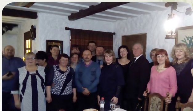
Профактив областной организации

Несмотря на внешние обстоятельства, обком Профсоюза выстоял в тяжелое время и совершенствовал формы и методы работы по защите социально-трудовых прав и интересов членов Профсоюза, развивал социальное партнерство профсоюзных органов с органами власти и работодателями, повышал информированность и правовые зна-