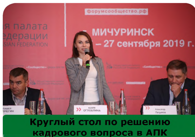
Круглый стол по решению кадрового вопроса в АПК